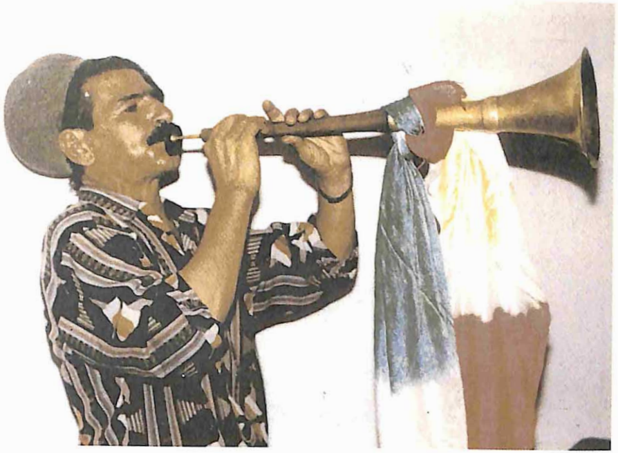
Zurna çalan bir İran Türkü